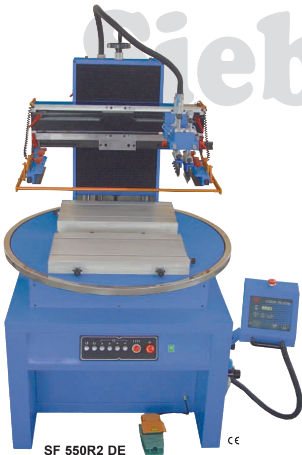
SF 550R2 DE als Flachdruckmaschine as flat printing machine