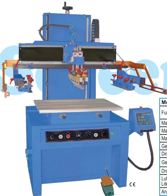
SFM 700 DE als Flachdruckmaschine as flat printing machine